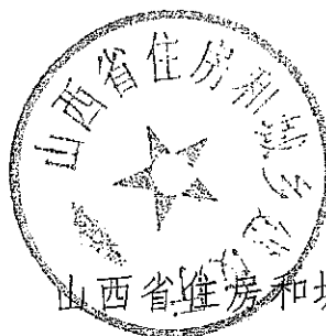
山西省住房和城乡建设厅