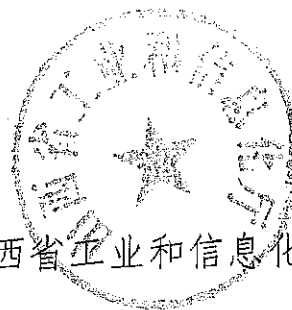
山西省工业和信息化厅