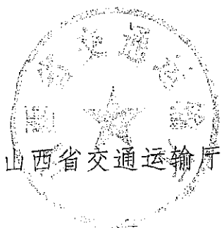
山西省交通运输厅