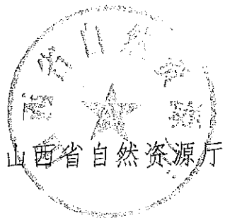
山西省自然资源厅