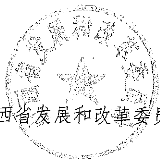
山西省发展和改革委员会

招标投标领域突出问题专项治理的通知》(发改办法规〔2023〕567号)精神,决定在全省开展工程建设招标投标领域突出问题专项治理。现将《工程建设招标投标领域突出问题专项治理实施方案》印发你们,请按照要求认真组织开展专项治理工作。